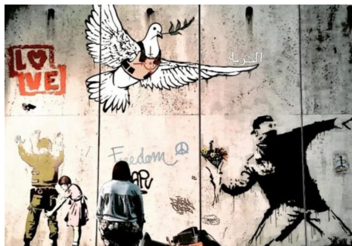
The World of Banksy a Roma Tiburtina

pubblici e privati, ad azioni, iniziative e programmi destinati a costruire una società in cui la convivenza tra le persone sia basata sugli ideali di dignità, di solidarietà e di pace, una parola bella e potente, la più importante di ogni giustizia.